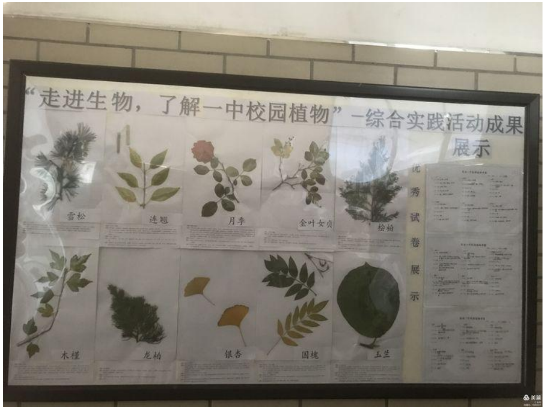
长治学院生物系赠送的植物标本