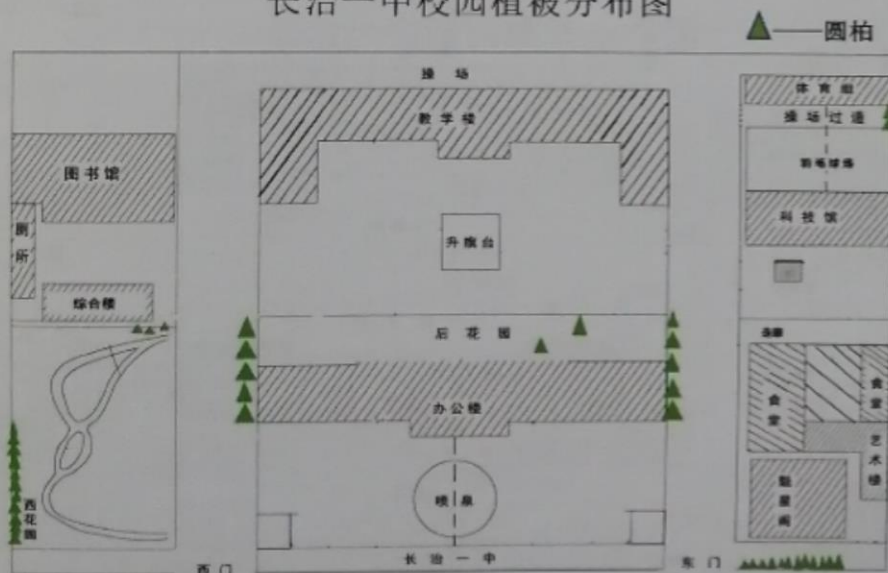
长治一中校园植被分布图