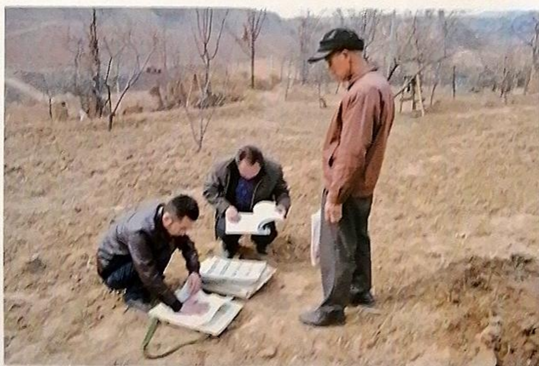
普查队员在野外压制标本