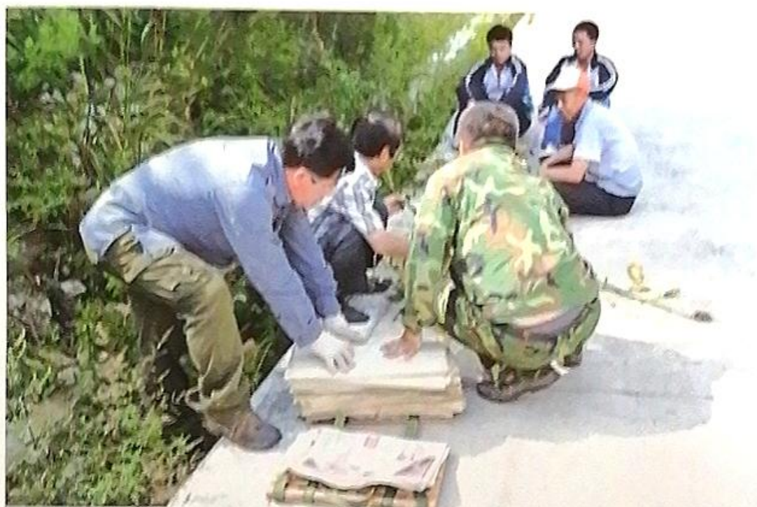
普查队员在野外压制标本