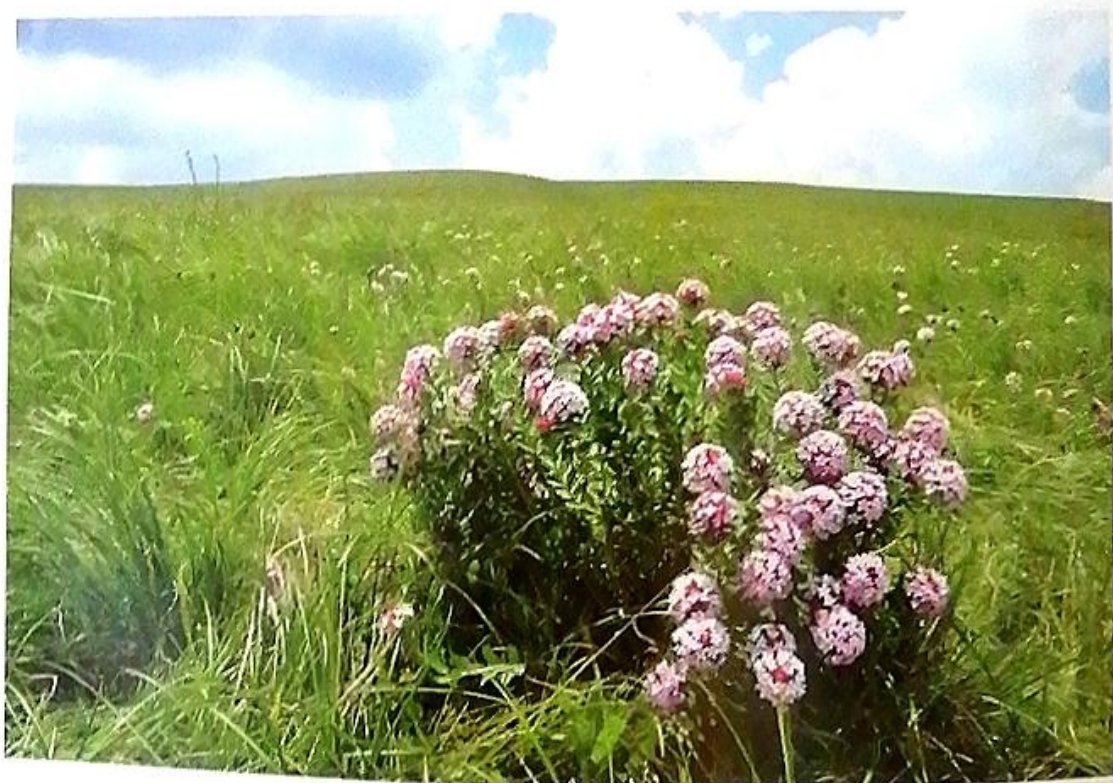
普查摄影大赛获奖作品（狼毒）