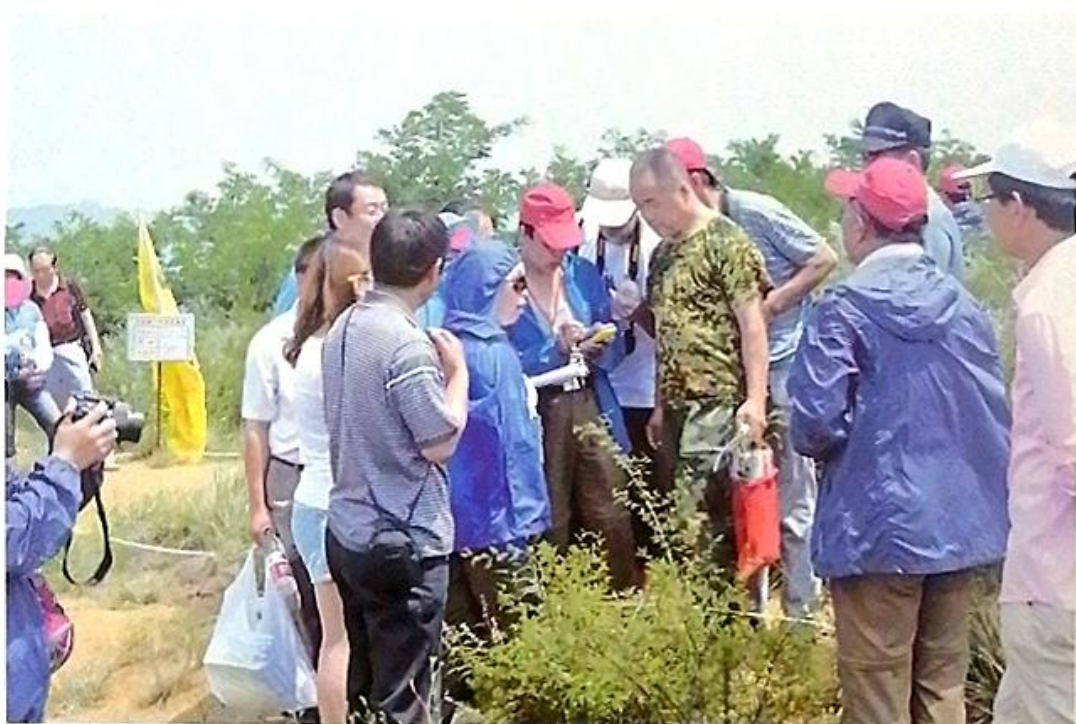
普查队员现场学习标本采集技术