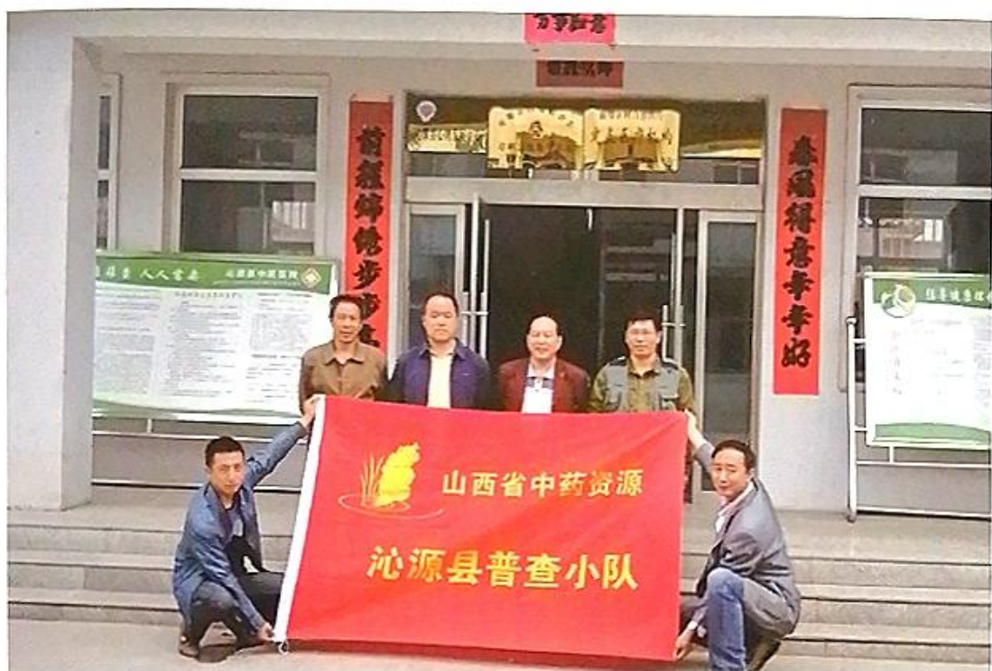
山西省中药资源沁源县普查小队