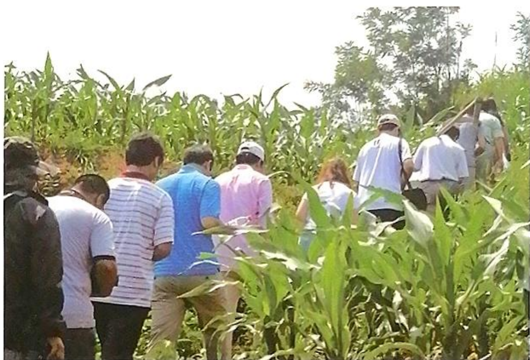
普查队员集中上山采集标本