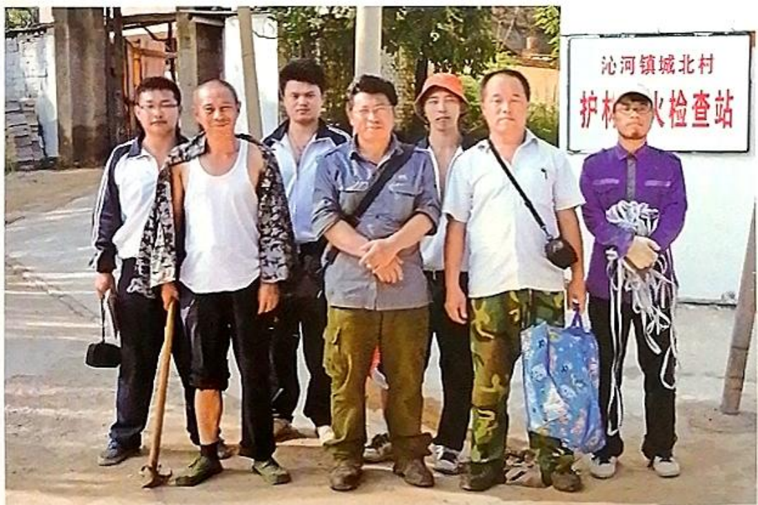
沁源县普查队员在沁河镇采集标本