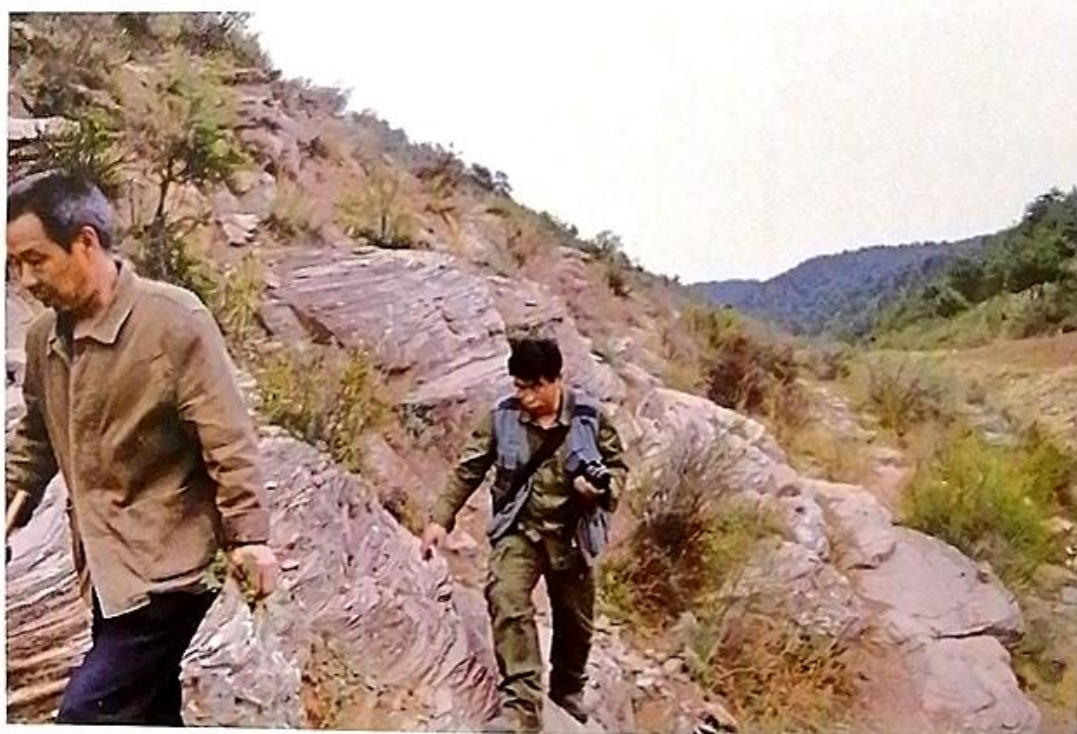
普查队员在崎岖的山路上行走