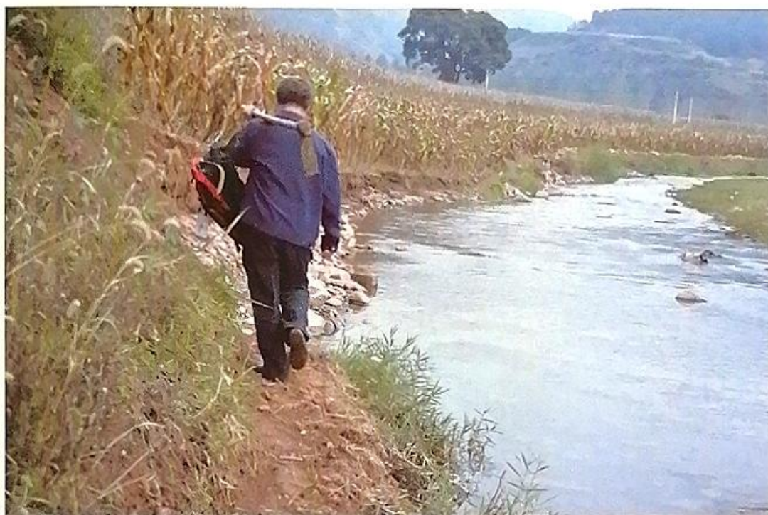
普查队员跋山涉水在沁河沿岸采集标本