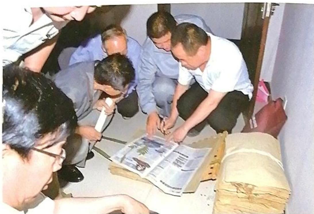
普查隊員在室內压制標本