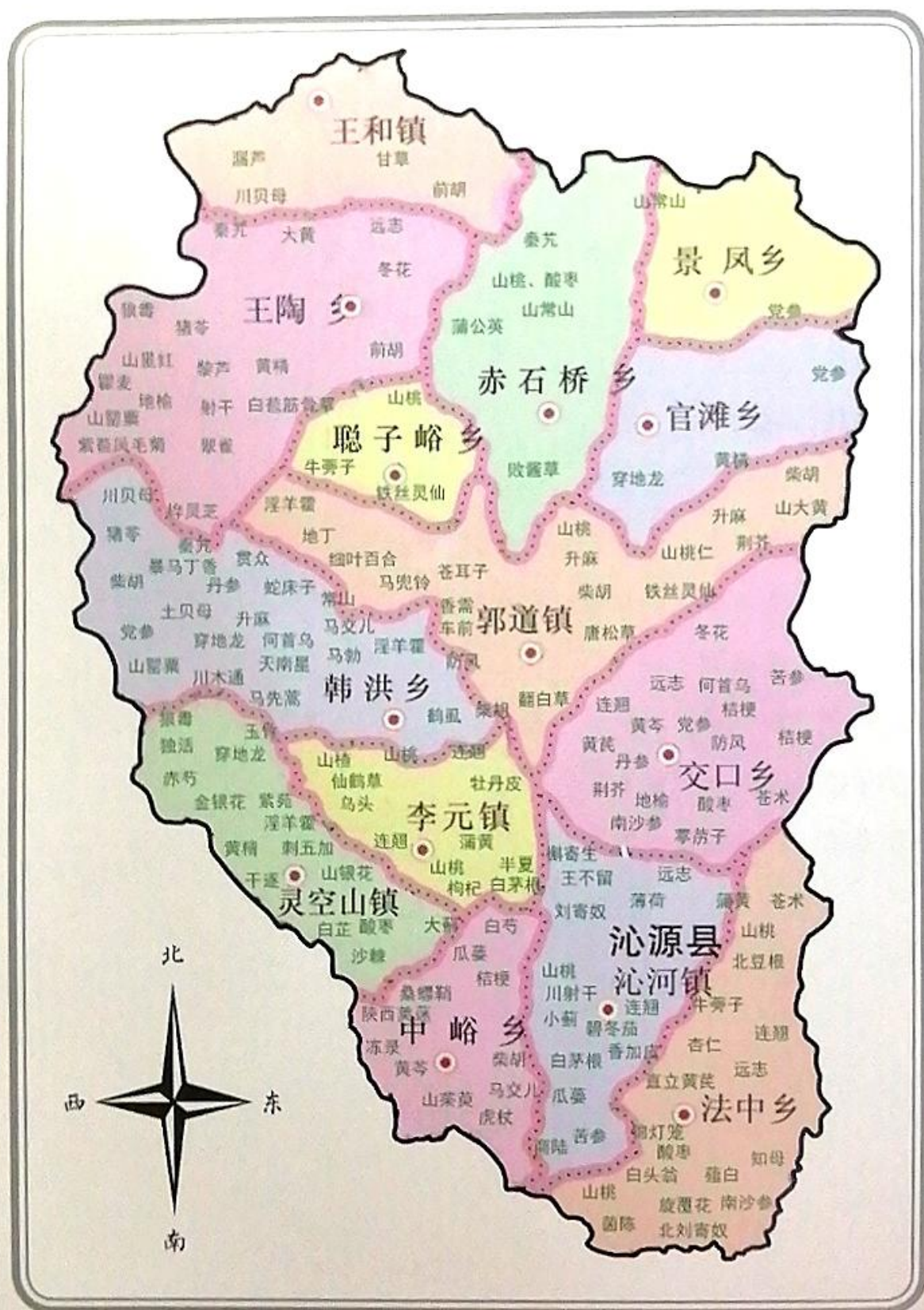
沁源县野生中药资源分布图