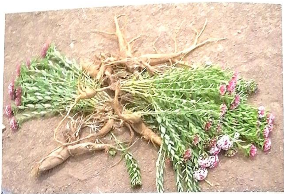
普查摄影大赛获奖作品（狼毒）