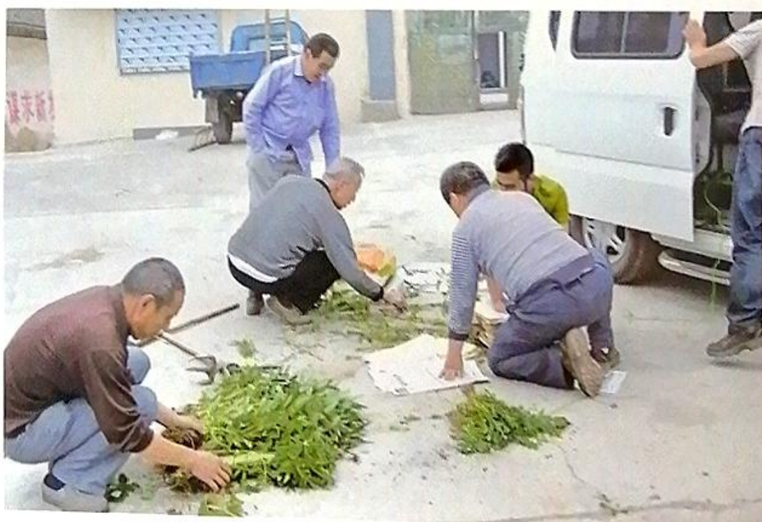
普查隊員在室外压制標本